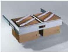
Hängerahmen voll ausziehbar, kugelgelagert, zwei verstellbare Mittelstege, einschließlich Auszugssperre Für Schrankbreite 930 mm: Bestell-Nr. 1070-811