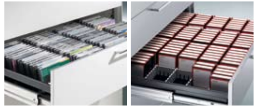
Inneneinrichtung CDs/DVDs im Jewel-Case

Aufgrund der gültigen Normen und Richtlinien (z.B. EN 14073-2) müssen Schränke gegen Kippen gesichert sein. Die Befestigungsart ist abhängig vom Wandmaterial. Bitte Schrauben und Dübel entsprechend der Wandbeschaffenheit verwenden (nicht beige packt)