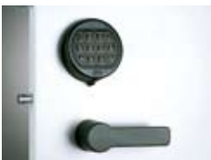
Weiteres Zubehör wie Sockel oder Abdeckplatten (hier: Elektronikschloss) auf Anfrage.