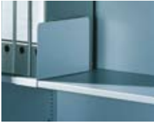
Aufschiebbare Aktenstützen passend für alle Einlegeböden, H 200 x B 100 x T 290 mm Bestell-Nr. 4222-25